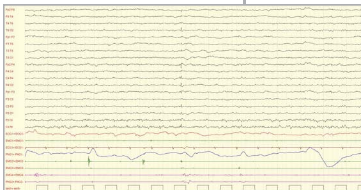
Figura 1. EEG: attività di fondo lenta e poco organizzata sulla quale si inscrivono scariche bilaterali di punte seguite da oscillazione lenta, incostantemente associate a scosse miocloniche agli arti superiori

EMG1: EMG muscolo miloioideo; PNG1: toracogramma; EMG2: EMG deltoide destro; EMG3: EMG deltoide sinistro; EMG 4: EMG tibiale destro; PNG2: EMG tibiale sinistro